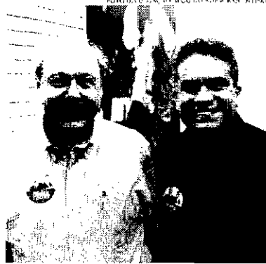
Peres e Rolfo romperam pouco depois de eleitos e passaram de parceiros e chapa e inimigos declarados na atual gestão

"É difícil fazer uma estimativa porque nunca tivemos o processo de impeachment. As referências são de processos eleitorais. A estrutura que estamos montando e para receber e aguardar 17 mil associados, virou o ex-presidente, que ainda lamentou a turbulência política vivida no clube e, principalmente, o quanto tudo isso prejudica a imagem do Santos".